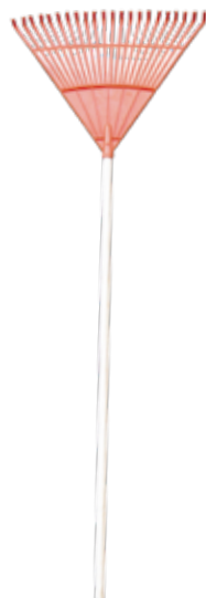
RASTRILLO BARREHOJAS PLÁSTICO C/M