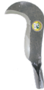
ROZON TRAMONTINA 004699K