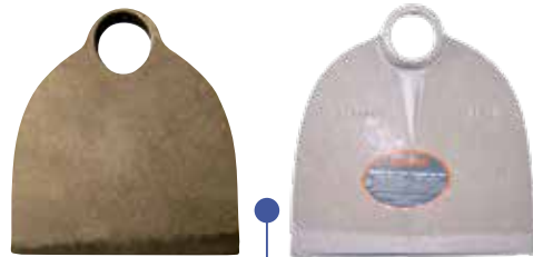
AZADON 6" 004508K 8" 0045020 8" C/MANGO 0164992 CON MANGO TRAMONTINA 0188336