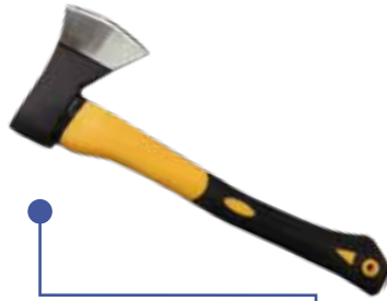
HACHA CAZADORA 0261629