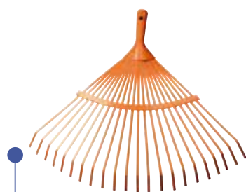
RASTRILLO BARRE HOJAS TRUPPER C/M