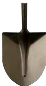
PALA CARRILANA CHINA S/MANGO