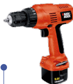
TALADRO INALÁMBRICO 9,6V CD 9600