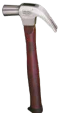
MARTILLO CARPINTERO TRUPPER