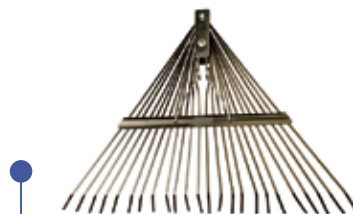
BARREHOJAS REFORZADO C/MANGO 24 DIENTES