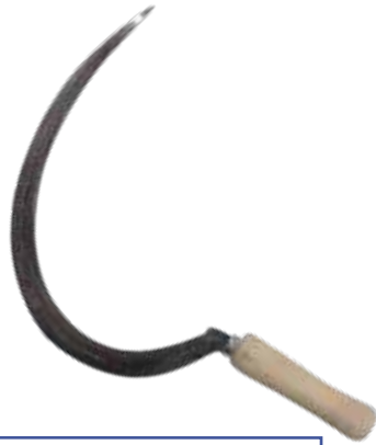
ECHONA TRUPPER 0238376