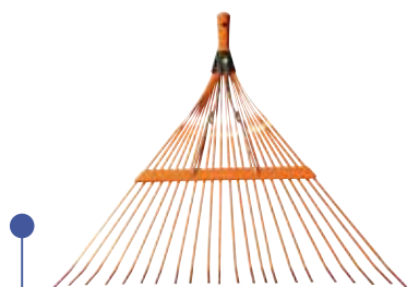
BARREHOJAS REFORZADO C/MANGO 22 DIENTES