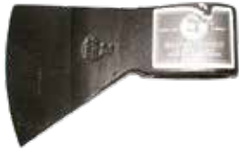
HACHA 4 1/2 LB. C/MANGO 0167789 CASCO 4 1/2 LIBRAS 0046000