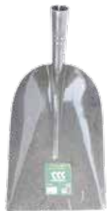
PALA CARBONERA C/MANGO