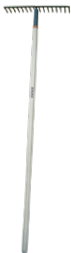
RASTRILLO 16 C/MANGO 60" TRENT