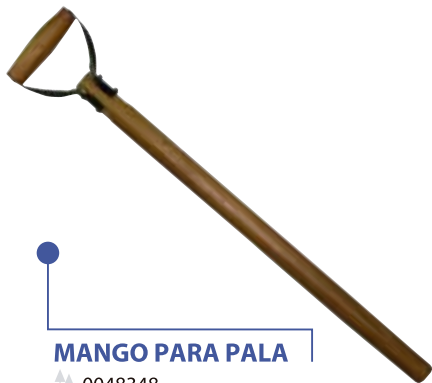
MANGO PARA PALA 0048348