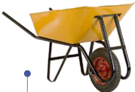
CARRETILLA 90 LT C/RUEDA 0048534