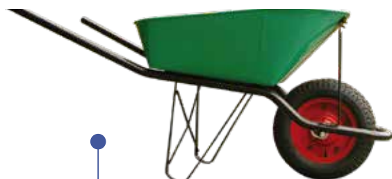
CARRETILLA STD BÁSICA 60 LTS 0047414