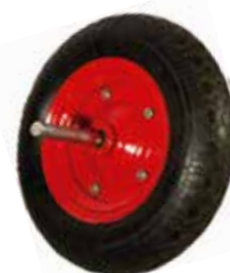
RUEDA CARRETILLA RUEDA NEUMÁTICA 0049352 RUEDA MACIZA 0049344