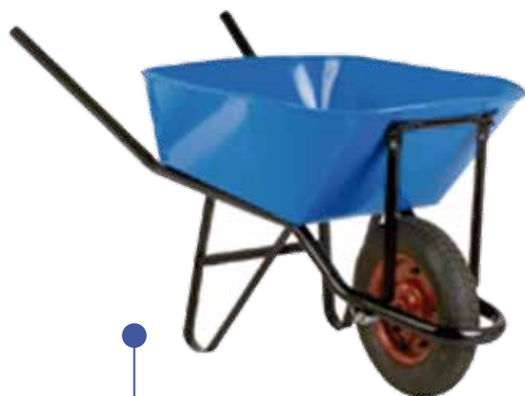
CARRETILLA ECON. 90 LT C/RUEDA 0045500