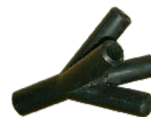
Descripción CH 80 Distribuidor Jetter Código 0033758