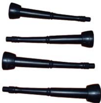
Descripción Pezonera SPO 200/236-2 A Código 0036528