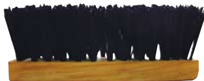
Descripción Código Escobillón Grande 004427K Escobillón Chico 0044288 Escobillón con Mango 0044369 Mango Escobillón 0049670