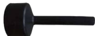
Descripción Código Copa Lavado Equipo Baumatic Cals 0038555