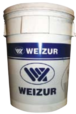
Descripción Código Weizur Detergente liq S100 10 lt 0084638