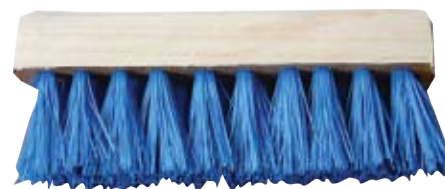
Descripción Código Escobilla Cerda Plástica 0044121