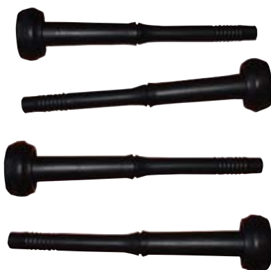
Descripción Pezonera Baumatic Cals Código 0038547