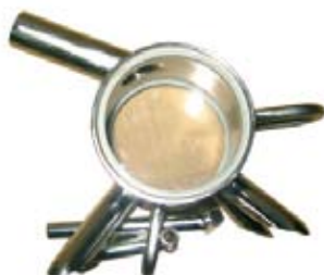
Descripción Colector Leche Baumatic Código 0039268