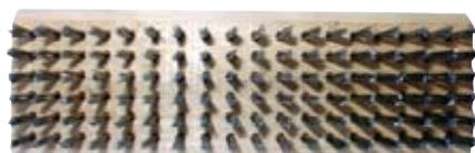
Descripción Código Escobilla Acero sin Mango 0044032