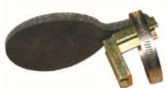
Descripción Código Válvula no Retorno Bomba Vacío 013970K