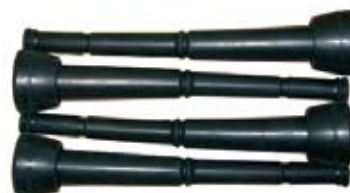
Descripción Pezonera SPO 200/225A Código 0033197