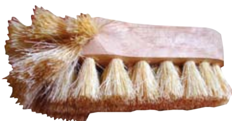
Descripción Código Escobilla Tampico 0044105