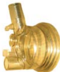
Descripción Tapa HCC (H.KLAPP) Código 0036587