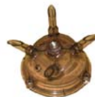
Descripción Tapa Mini Orbit Código 0038334