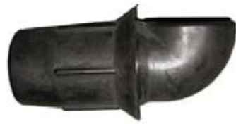
Descripción Código Entrada de Leche Fresca 2" 0035076