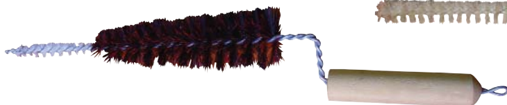
Descripción Código Escobilla Pezonerá 0044075