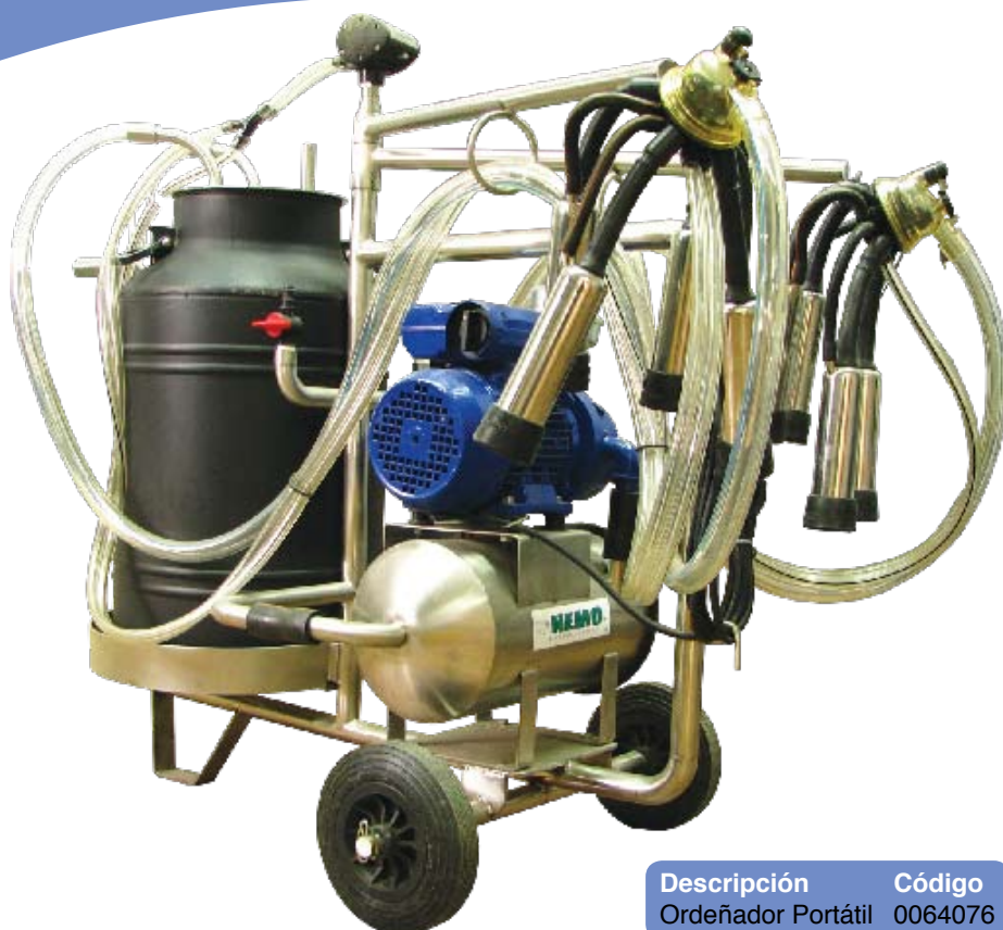
Descripción Ordeñador Portátil Código 0064076