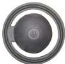
Descripción SP010 Valvula no Retorno A Laval Código 0033189