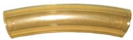
Descripción Código TL 010 Manguera Leche Transparente 0033294