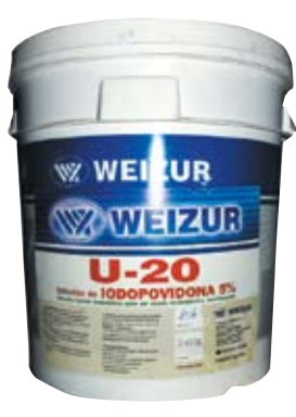
Descripción Código Weizur Yodo Povidona 5% 10 lt 0123900