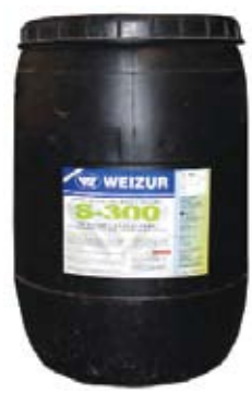
Descripción Código Weizur S-300 60 kg 0124826