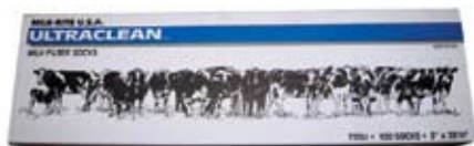
Descripción Código Filtro Leche 3"x23 1/2" 0081612 Filtro Leche Spartan 2 1/4" 008316K Filtro Leche 2" 100 und 0083151