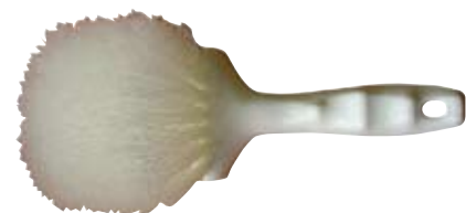
Descripción Código Cepillo Nylon con Mango 003357K