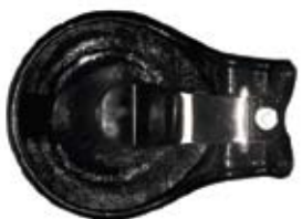
Descripción Código Bebedero Metálico 0130567