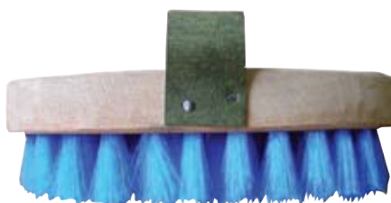
Descripción Código Escobilla Ovalada 0044172