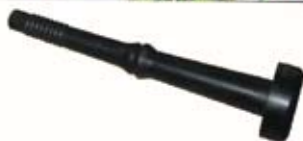
Descripción Pezonera 10048 Código 0131695 Juego 4