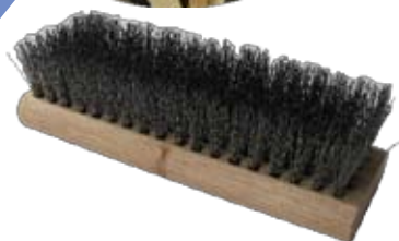
Descripción Código Escobilla Acero Ondulado S/M 0094862