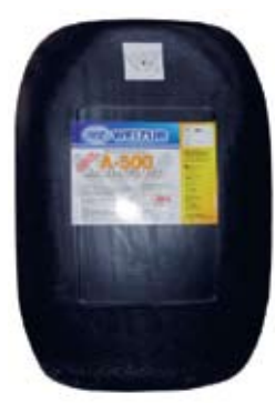
Descripción Código Weizur Acido A-500 60 lt 0123862