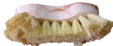
Descripción Código Escobilla 2 Cabezas 0044113